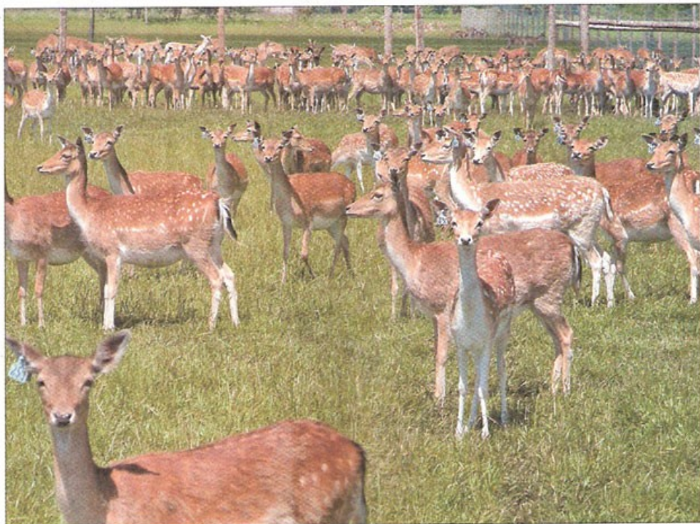
■ W Przynotecku hodowla danieli zajmuje obszar 53 ha, podzielony na 3-, 5-hektarowe kwatery. Obecnie w stadzie podstawowym utrzymywanych jest około 700 łań.

W pierwszym etapie rozwoju hodowli zakupiono 350 zacielenych łań i 20 byków. Dodatkowo, by zapewnić dużą różnorodność genetyczną, sprowadzili pewną ilość zwierząt z hodowli węgierskiej i austriackiej. Zakupione zwierzęta były w wieku od 2 do 6 lat. Daniele przed zakupem przeszły ostrą selekcję, aby wyeliminować chore i słabe osobniki. Dzięki temu obecnie stało ich około 700 łań.